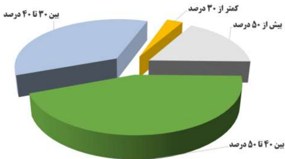
شکل شماره ۱: پیش‌بینی تورم سال ۱۴۰۳ از دید کارشناسان رشته اقتصاد.