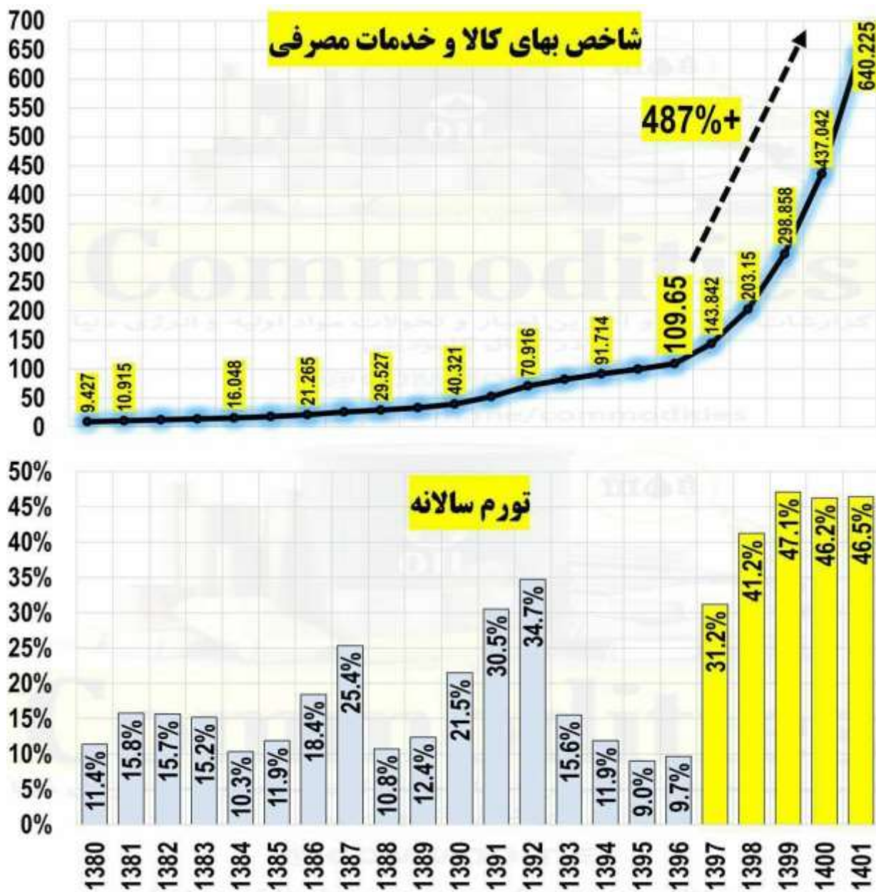
شکل شماره ۲: افزایش ۴۸۷ درصدی نرخ تورم در ۵ سال.

به گزارش «سایت دیده‌بان ایران»، نرخ تورم ۵ سال اخیر از سال ۱۳۹۷ تا سال ۱۴۰۱ به محدوده ۴۸۷ درصد رسید نمودار کامودیتی از وقوع زلزله‌ای مخرب در سبد معیشت خانوارهای ایرانی حکایت دارد. تورم ۵ سال گذشته، بدترین شوک معیشتی است که خانوارهای ایرانی دست‌کم در ۱۰۰ سال اخیر تحمل کرده‌اند.